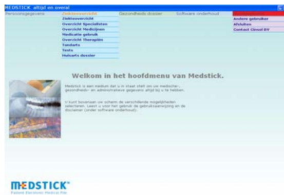
Menu principal de Medstick

s'arrêter de fumer, détails sur le poids et une encyclopédie médicale.