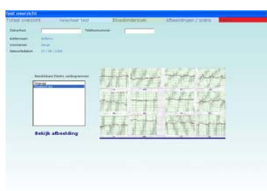
Données du dentiste