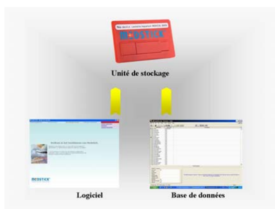
Présentation schématique du produit Medstick

Medstick en lui-même se compose d'un appareil numérique personnel (unité de stockage), d'un programme logiciel et d'une base de données. Medstick peut donc s'utiliser sur tous les ordinateurs.