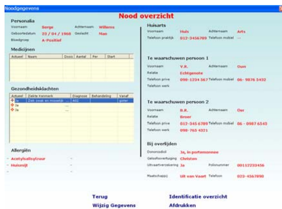
Overzicht van NOOD-gegevens

Een belangrijk veld is het Nood-overzicht . Hiermee kunnen spoedeisende-hulpverleners zonder autorisatie de belangrijkste medische gegevens inzien. Deze mogelijkheid kan levens redden van patiënten die op een bepaald moment buiten bewustzijn verkeren of te verward zijn om adequate informatie te verschaffen.