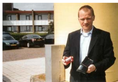
Altijd en overal medische gegevens