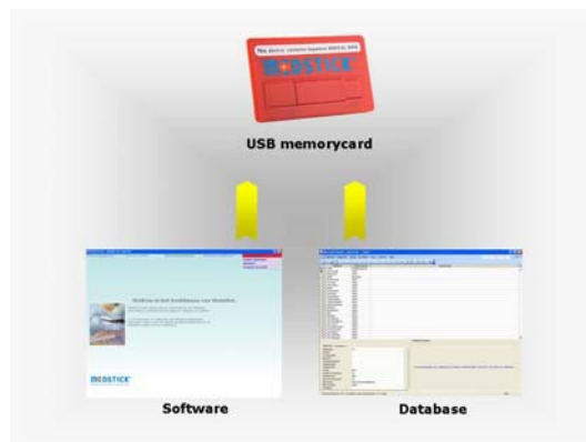
Schematische voorstelling van Medstick

Medstick kan op alle computers aangesloten worden via een USB-aansluiting.