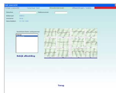
Electro Cardio Gram