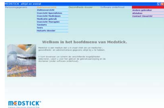
Hoofdmenu van Medstick

Er zijn schermen voor naw-gegevens, ziektegegevens, eerste hulp, ziekenhuisopname, medicijngegevens, therapieën, tandarts, geboortedetails, lengte / gewicht-groei-curve, vaccinaties, stoppen met roken-overzicht, gewichtsgegevens en een medische encyclopedie. Er zijn in totaal meer dan 35 schermen met informatie!!!